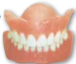
Volledige boven- en onderprothese

Ons bedrijf is volledig ingericht om u van dienst te zijn. Wij werken nauw samen met tandarts en implantoloog om u voor iedere situatie de juiste oplossing te kunnen bieden. Onze tandtechnici doen een groot deel van de behandeling. De lijnen zijn daardoor kort. En wij zijn daarom in staat optimaal aan uw wensen te voldoen.