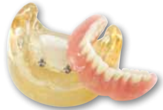
Prothese op implantaten

Maar ook voor dit vervolgtraject geldt dat onze tandtechnisch specialist in nauwe samspraak met u de verdere behandelingen in zo kort mogelijke tijd realiseert. Voor implantaatgedragen protheses gaat u tenslotte nog eenmaal ter eindcontrole en definitieve plaatsing terug naar de impantoloog.